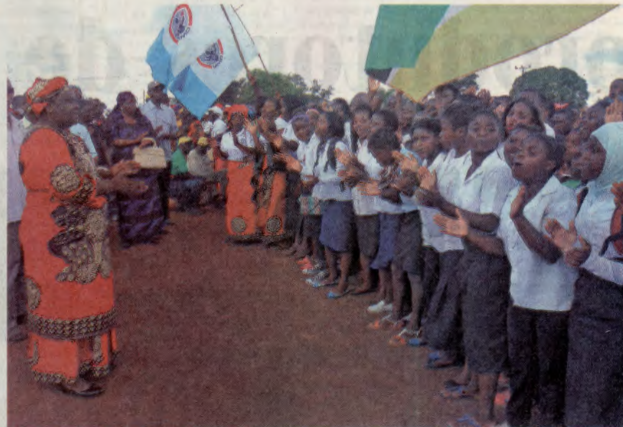
Populações locais pedem água, energia e hospitais

T rata-se de áreas em que o seu gabinete e parceiros têm vindo a delinear estratégias para a redução da vulnerabilidade da mulher, prevenir os casamentos prematuros e gravidezes precoces,